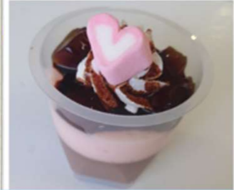
イチゴとチョコの ムース